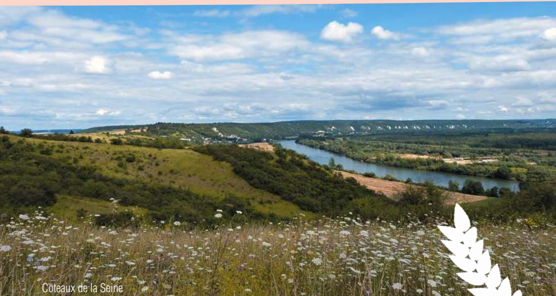
Coteaux de la Seine

dans le Parc naturel régional du Vexin français