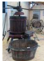
Maison de la Vigne

Le moulin de la Naze (maison de la Meunerie) à Valmondois retrace la vie quotidienne des meuniers de la vallée du Sausseron.