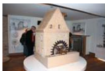
Moulin de la Naze