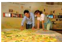
Musée du Vexin français

La vocation agricole du territoire est illustrée au musée de la Moisson à Sagy autour d'une remarquable collection de machines et d'outillage agricoles présentée dans un ancien corps de ferme réhabilité.