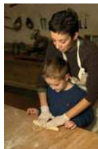
Maison du Pain