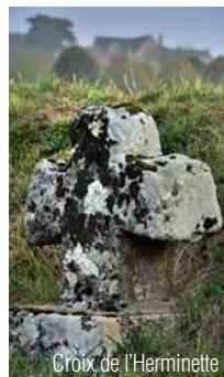
Croix de l'Herminette